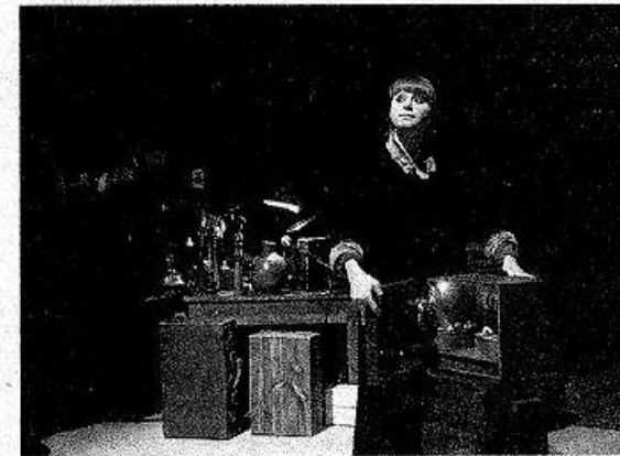
Le public s'est beaucoup amusé du récit des deux comédiens

De là s'ensuit tout une série de situations insolites prêtant à des jeux de mots. C'est ainsi que l'on fait la connaissance d'un canard peint en jaune, comme le soleil, afin de se réchauffer ou encore la voiture hérissée avec ses multiples antennes, le chevalier de l'ordre des portes secrètes ou ce gros «doudou» noir aux yeux inquiétants. Sur une mu-